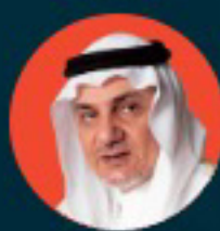
صاحب السمو الملكي الأمير تركي الفيصل رئيس مجلس إدارة مركز الملك فيصل للبحوث والدراسات الإسلامية