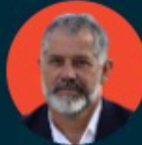
لو جاكو مخرج أفلام وثائقية حائز على جائزة الأوسكار