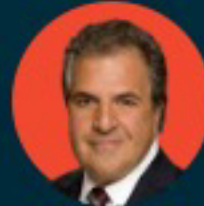
جيم جيانوبولوس الرئيس التنفيذي ورئيس مجلس الإدارة السابق لشركة The 20th Century Fox