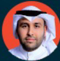
عبدالله العبدالله مدير عام الأرشيف الوطني للأفلام في هيئة الأفلام