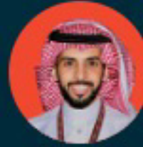
عبدالعزيز الشلاحي مخرج