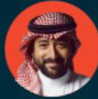
ياسر السقايف إعلامي وممثل