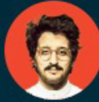
علي الكلثمي ممثل ومخرج