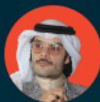
حكيم جمعة خائب وممثل ومخرج