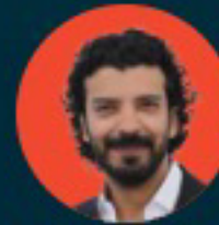
يعقوب فرحان ممثل