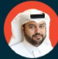
عبدالله القحطاني الرئيس التنفيذي لهيئة الأفلام