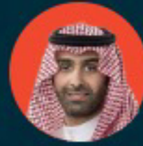
ماجد الحقييل الرئيس التنفيذي لصندوق التنمية الثقافي