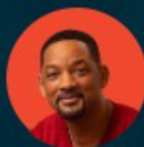
ويل سميث ممثل وممثل